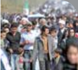
طبق اعلام معاون اداره کل کار، تعاون و رفاه اجتماعی استان کرمان، براساس سرشماری سال ۱۳۹۵، ۳ میلیون و ۱۶۴ هزار و ۷۸ نفر در استان کرمان زندگی می کنند که ۶۰۹ هزار نفر آن در پایه سنی جوان قرار