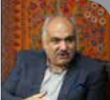
مدیرکل میراث‌فرهنگی، گردشگری و صنایع‌دستی استان کرمان از ثبت ۹ اثر ناملموس این استان در فهرست آثار ناملموس فرهنگی و تاریخی کشور خبر داد.