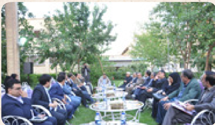
▲ اردیبهشت ماه؛ دیدار هیات نمایندگان دوره هشتم اتاق کرمان با استاندار در آغاز دوره جدید