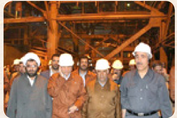
▲ ۱۹ خرداد ماه؛ بازدید استاندار رزم حسینی از مس سرچشمه