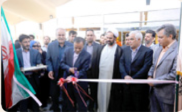
▲ ۲۳ خرداد ماه؛ بهره برداری از رام دوم قطار مسافربری کرمان - تهران