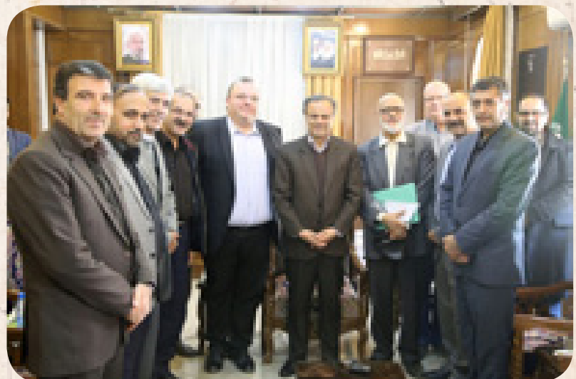
➤ آذرماه: قرارداد اجرای نیروگاه خورشیدی امضا شد