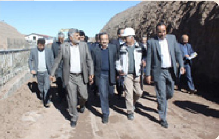
➤ دی ماه: بازدید فرمانده قرارگاه خاتم الانبیاء از پروژه‌های در حال اجرای این قرارگاه در کرمان