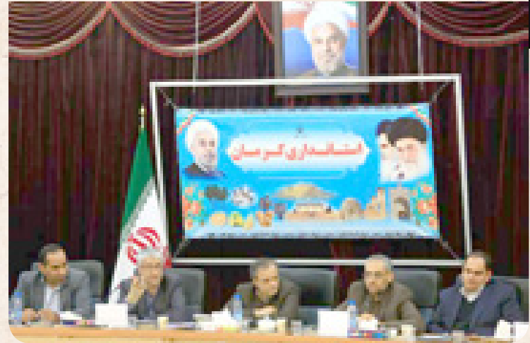
➤ ۱۳ دی ماه: نشست شورای آب استان در محل استانداری کرمان