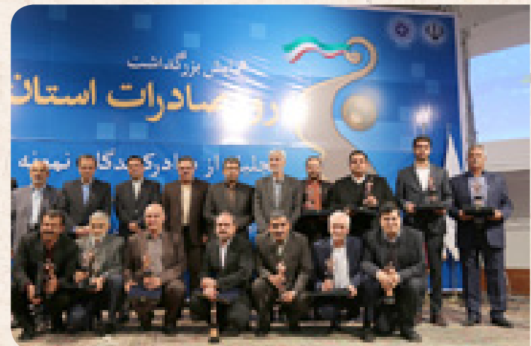
➤ ۲۰ دی ماه: معرفی صادرکنندگان برتر استان در سال ۹۴