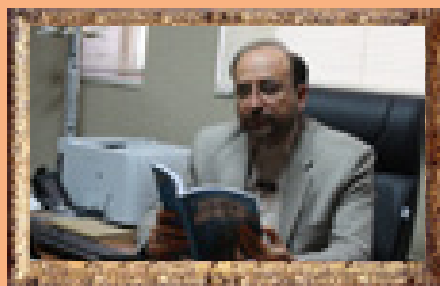
مدیرکل امور اقتصادی استانداری کرمان: عاقبت تفاهم‌نامه‌های اقتصادی