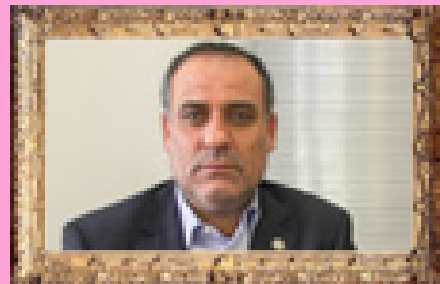
تحلیلی از مدیر کل بیمه ایران کارنامه صنعت بیمه استان در سال ۹۴