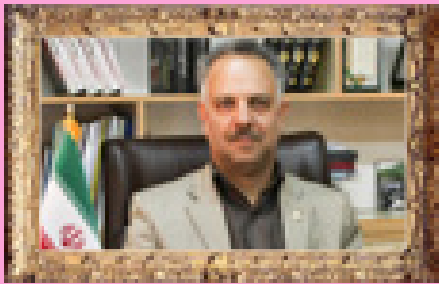
گفت‌وگو با دبیر شورای هماهنگی بانک‌های استان همراهی شبکه بانکی با توسعه استان