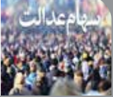
رئیس کمیسیون اقتصادی مجلس از موافقت اولیه رئیس‌جمهور برای واگذاری سهام عدالت به جاماندگان سهام عدالت خبر داد. آمارها نشان می‌دهد که بیش از ۲۱ میلیون نفر مستحق دریافت سهام عدالت بودند اما به آنها سهمی واگذار نشده است در