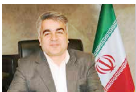
مدیرعامل مس شهید باهنر خبر داد: