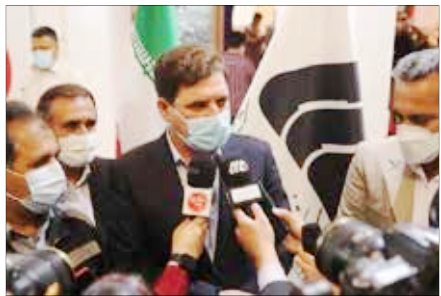
استاندار کرمان در بازدید از پنجمین نمایشگاه کیمیکس در کرمان: