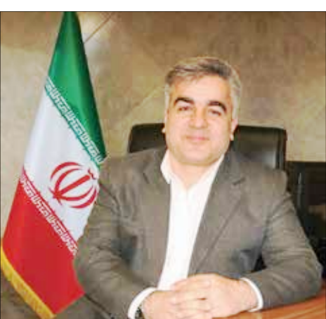
مدیرعامل مس شهید باهنر خبر داد:

رصد شاخص مدیران خرید از بخش صنعت همچنین نشان دهنده آن است که شاخص موجودی مواد اولیه در شهریورماه عدد ۴۸.۷۵ بوده که برای چهارمین ماه پیاپی همچنان روند کاهشی داشته است هرچند شدت کاهش آن نسبت به ماه قبل اندکی کاهش شده است. افزایش شدید قیمت مواد اولیه و نوسانات