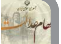
دستار ویژه و مشاور رئیس سازمان بورس در امور سهام عدالت گفت: در حال حاضر هیچ ثبت نامی برای سهام عدالت انجام نمی شود.

به گزارش ایسنا،و در ادامه ضمن بازدید از وضعیت ارتباطی و دسترسی به اینترنت روستاهای هستنان کیسکان پیگیر ارتقاء تکنولوژی سایت همراه اول در این منطقه شد.