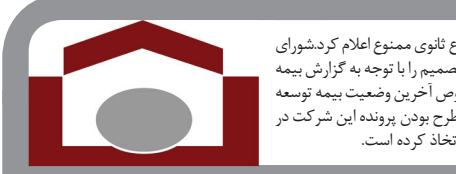
هیات مدیره شرکت بیمه توسعه

جدول شماره ۱ ترازنامه شرکت اصلی است( در این شرکت سهم سهامداران عمده بسیار بیشتر از مردم و سهامداران جزء است و همانطور که دیده می شود حقوق صاحبان اصلی شرکت حساسی پر و پیمان است) که در آن موجودی نقدی تنها ۴ میلیارد تومان است البته ردیف سرمایه گذاری کوتاه مدت نیز سیرده بانکی نیست بلکه در واقع تمام دارایی از ملک شاندیز است که طی یک عملیات جالب ۴۰درصد زیر ارزش کارشناسی به بانک فروخته شده( بابت تسهیلات دریافتی ) و مجدداً به ارزش روز و به صورت قسطی بازخرید شده است. در واقع تمام دارایی جاری این شرکت حدوداً ۱۷۰۰ میلیارد تومان است که ۱۴۵۰ میلیارد از آن مربوط به پروژه های شرکت انبیه هست که قطعاً قابلیت نقد شدن به سادگی را ندارد. یعنی اگر ۵ درصد مردم برای فروش سهامشان هجوم بزنند عملاً سهامدار عمده قادر نخواهد بود در بازخرید سهامشان که ظاهراً ۴۰ روزه هست به تعهداتش عمل کند. و مابقی می روند برای یک زمان طولانی که احتمالاً در صورتی که وارد احتلال شود یک پروسه